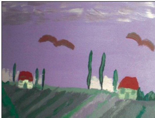
Farbenfrohe Erinnerung an Frankreich.